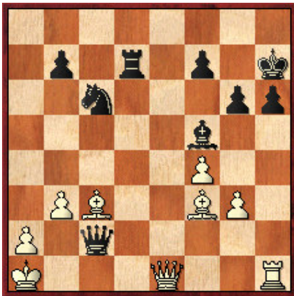
7 Juegan las blancas