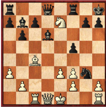
2 Juegan las blancas