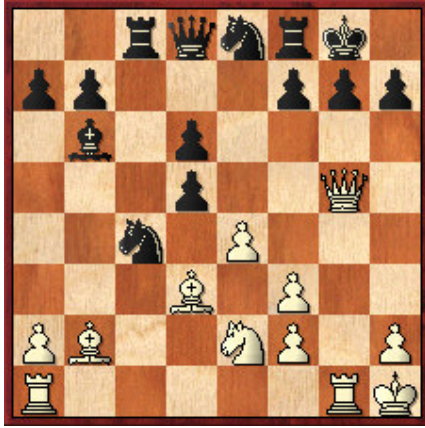
5 Juegan las blancas