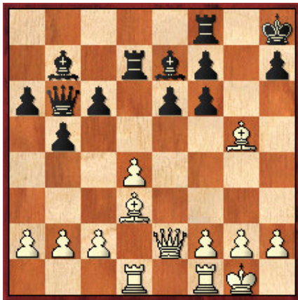
8 Juegan las blancas