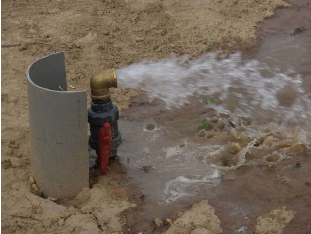
Hidrante suministrando agua a una parcela