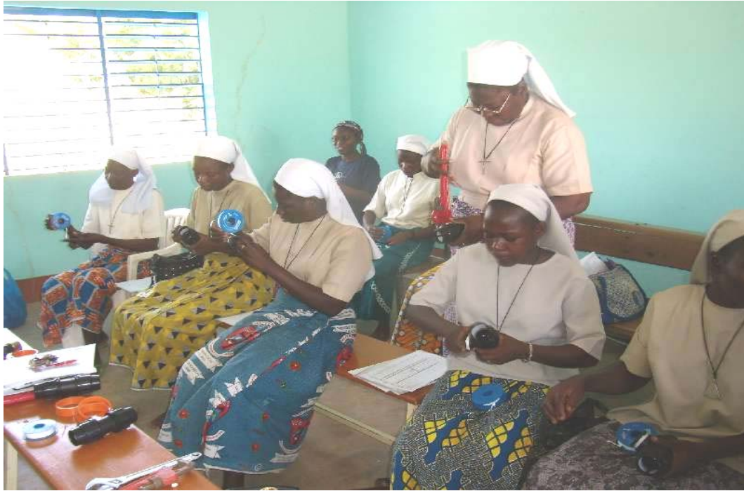
Prácticas de montaje de instalaciones de riego. Quince hermanas de cinco distintas Congregaciones. Residencia de S.I.C. en Kosoghen