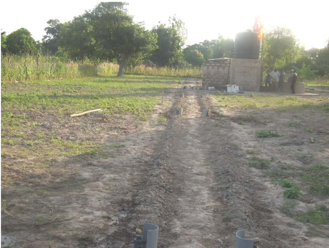
Una de las dos calles de parcelas. Boca de riego en cada parcela, con pequeña protección