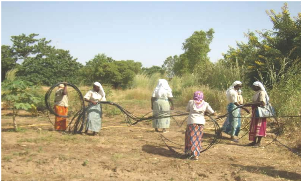
Práctica de instalación y montaje en Centro de Formación de los Padres Blancos. Se realizaron tres distintas instalaciones