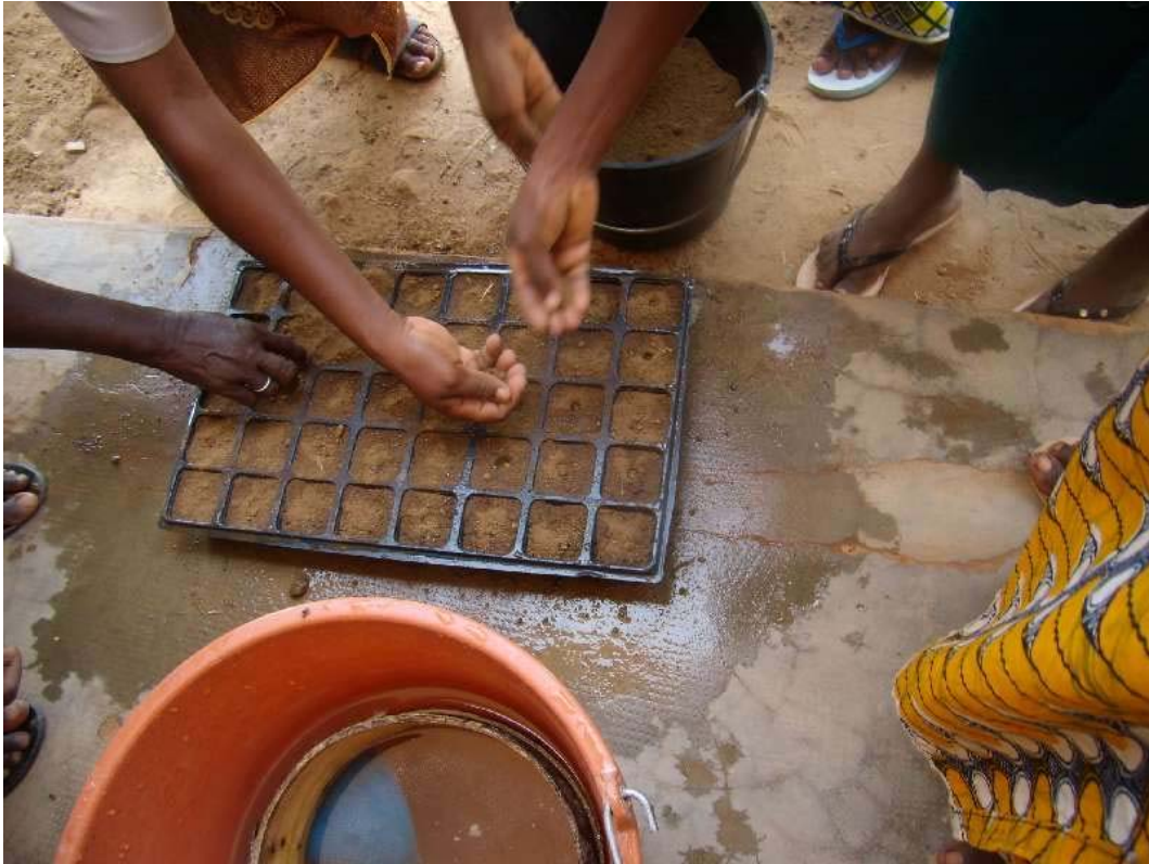
Prácticas de elaboración de sustratos, semillado y trasplantes