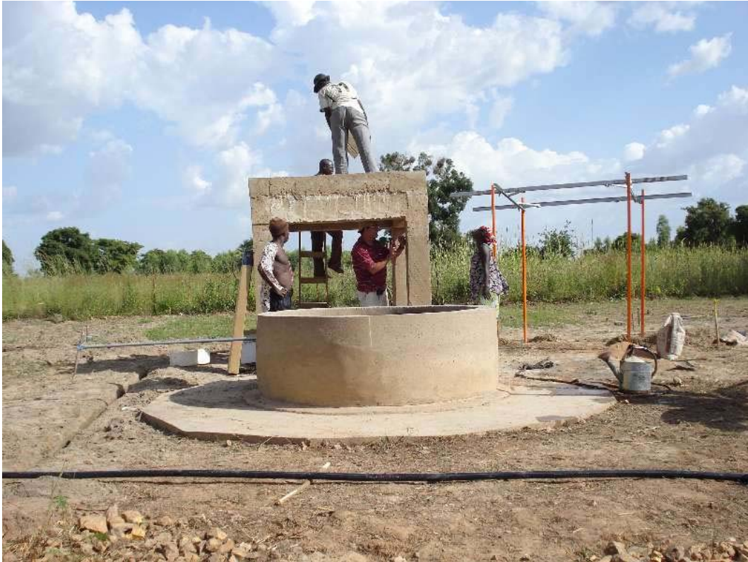
Instalación en Kaari

Primer día de montaje. Replanteos, realización de zanjas, extendido de tuberías, inicio montaje soporte paneles, nivelación apoyo base depósito, etc.,