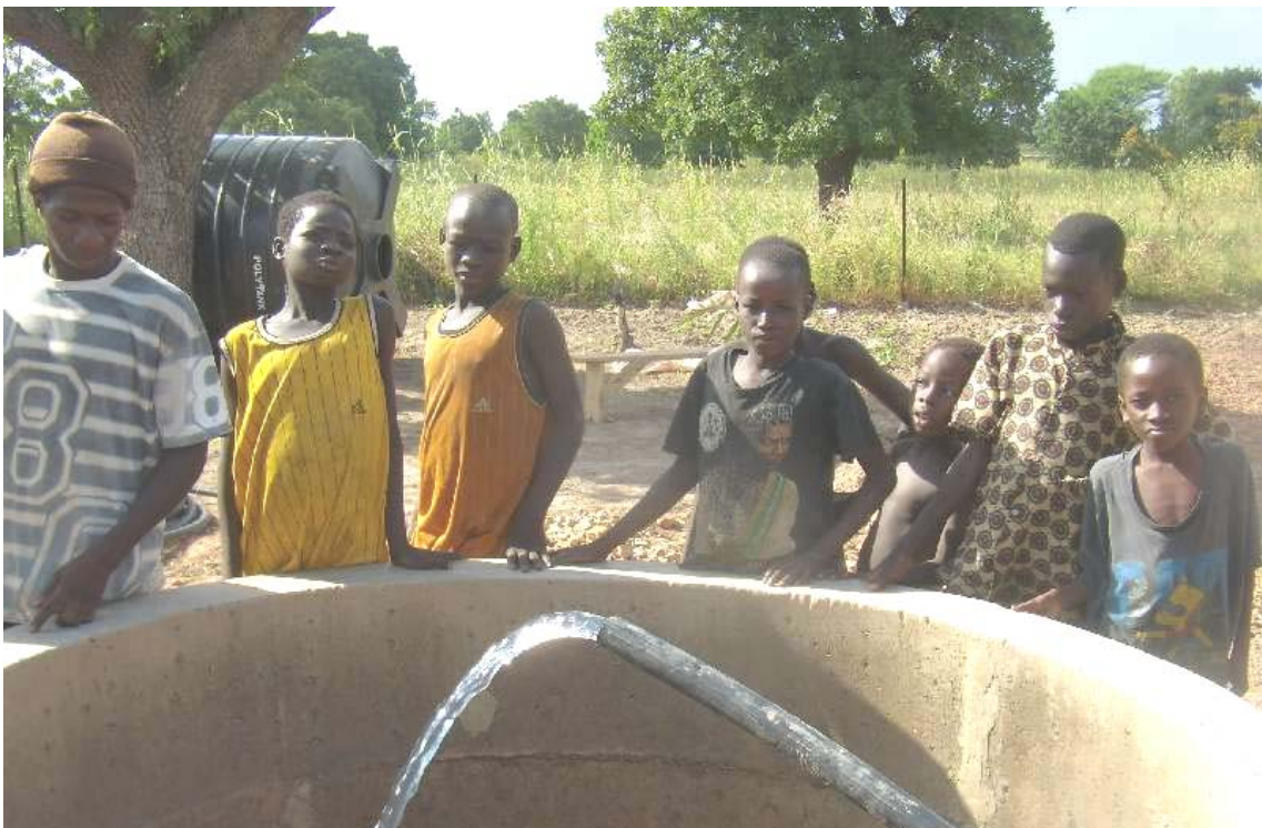
Prueba del bombeo. Superadas las expectativas más optimistas

Primer día de montaje. Replanteos, realización de zanjas, extendido de tuberías, inicio montaje soporte paneles, nivelación apoyo base depósito, etc.,