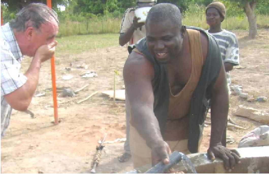
Prueba real. Agua de muy buena calidad y producción del pozo por encima de las necesidades actuales de 10-12.000 litros-día