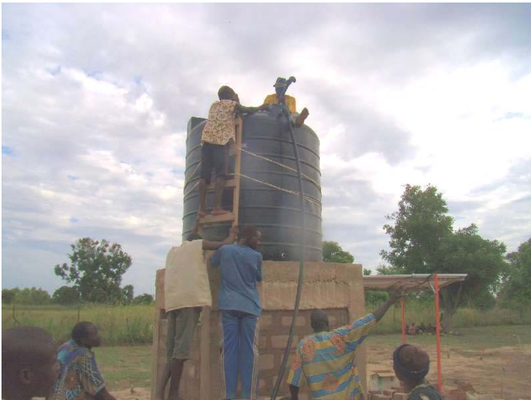
Conexión del depósito a bombeo y red de suministro. Pruebas de estanqueidad. Fondo derecha, paneles sobre estructura