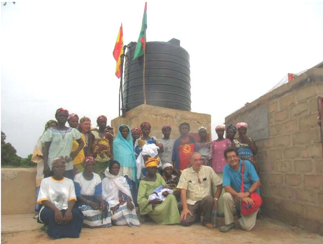
Con la mayor parte de las veinte mujeres, beneficiarias de esta obra.