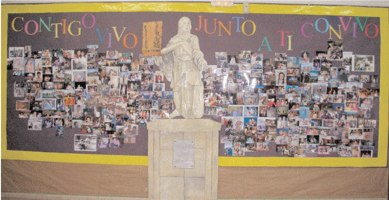
Mural realizado con fotografías de alumnos y alumnas del nuestro «cole»