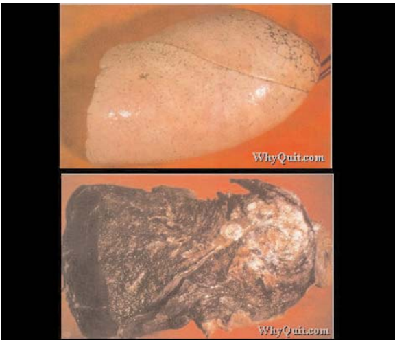
Pulmón sin cáncer y con cáncer

El cáncer de pulmón representa el 13% de todos los diagnósticos de cáncer y el 29% de las muertes en hombres y mujeres.