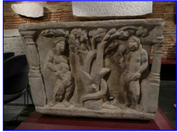
Museo Raymond. Sarcófago paleocristiano. Detalle.