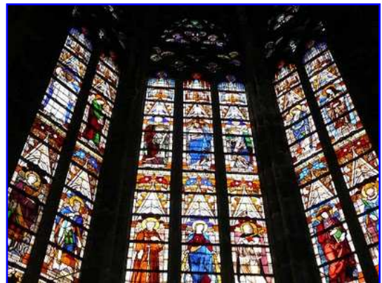
Catedral de San Esteban. Vitrales.

En esta imagen se ve el coro de la catedral, construido con posterioridad a la nave. Se compone como el gótico clásico de tres alturas, nivel de arcos formeros, en este caso apuntados, amplios y elevados, nivel de triforio, en este caso ciego y claristorio de iluminación cuyo perfil arquitectónico incluye al triforio. Al fondo se observa el retablo mayor dedicado al titular de la catedral, San Esteban.