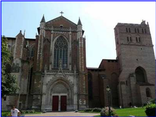
Catedral de San Esteban. Fachada norte.

La catedral de San Esteban de Toulouse se compone básicamente de dos grandes construcciones, la nave de origen y sabor románico y el coro, de doble longitud que la nave, de impronta gótica. No existe una alineación exacta de ambos cuerpos. La parte románica se iniciaría hacia 1071 con el obispo Isam. En 1609 la bóveda del coro se quemó y el arquitecto Pierre Levesville construyó una bóveda de crucería. La fachada oeste se estructura gracias a un gran arco gótico apuntado que enmarca a la portada, también ojival, y a un gran rosetón todo ello básicamente realizado en piedra.