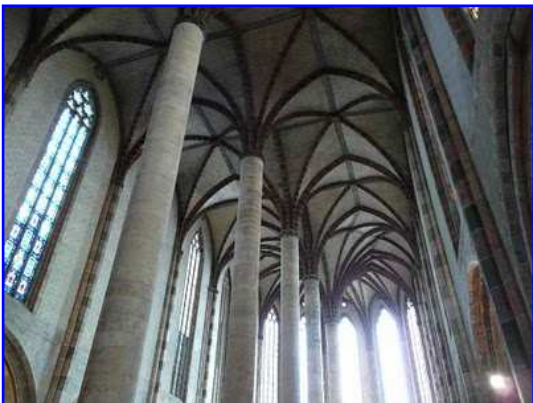
Iglesia de los Jacobinos. Vista interior de naves y cabecera.

En la imagen de la cabecera de la iglesia se observa un cuerpo inferior con vanos apuntados y un gran cuerpo superior o nivel alto con grandes ventanales ojivales góticos entre potentes contrafuertes o estribos que se retranquean conforme ascendemos en altura y que culminan en gárgolas de piedra. Sobre los ventanales apuntados se abren grandes óculos. La torre, sólida y recia, es de planta poligonal que en su cuerpo bajo predomina el muro macizo de ladrillo y según subimos en altura los cuerpos se abren con vanos mitrales similares a los de San Sernin de Toulouse. Como culminación de la torre se despliega una balaustrada en cuyos ángulos se alzan pequeños pináculos de piedra