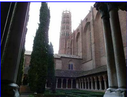
Iglesia de los Jacobinos. Claustro.

Las pandas del claustro se estructuran mediante arquerías de medio punto levemente apuntadas, realizadas en ladrillo pero con soporte pétreo de columnas pareadas con capiteles adornados con motivos vegetales y figurados.