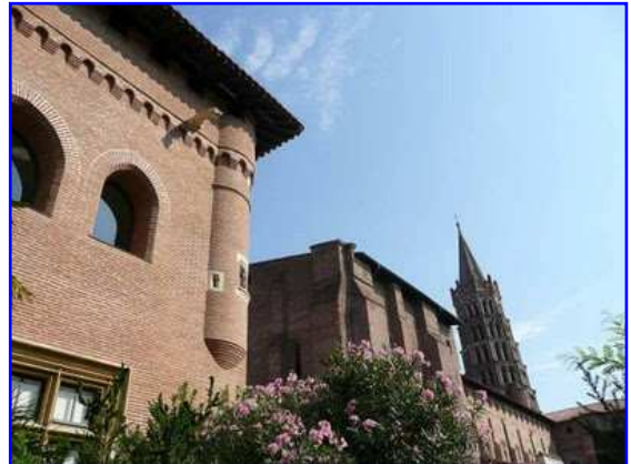
Museo Raymond. Vista parcial. Al fondo la basílica de San Sernin.