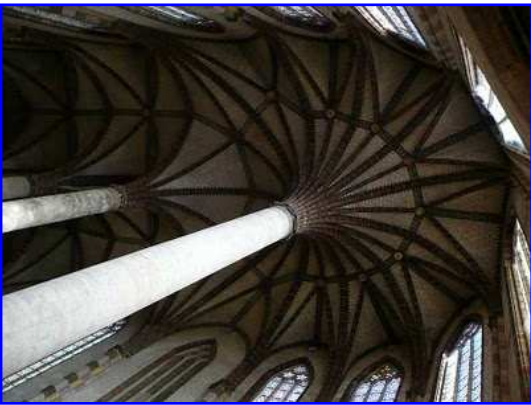
Iglesia de los Jacobinos. Vista de la bóveda de palmera.

En esta imagen se observa el interior de la iglesia vista hacia occidente. Se ve el interior de la fachada occidental con su nivel de arcos formeros, su nivel de arcos apuntados y su nivel de óculos, ambos cerrados con vidrieras. Apenas se observan las capillas situadas entre los estribos.