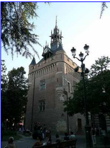
Donjon o torre del Capitoul