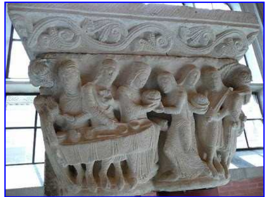
Capitel románico figurado de doble columna.