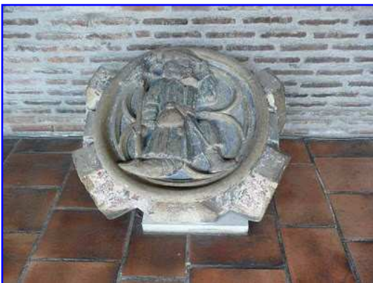
Museo de los Agustinos. Clave de bóveda esculpida.