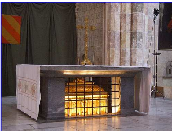
Iglesia de los Jacobinos. Reliquias de Santo Tomás de Aquino.

Uno de los grandes valores de la Iglesia del Convento de los Jacobinos es que en sus paredes se conservan gran parte de las pinturas murales policromadas (en muchos templos han desaparecido lo que nos hace pensar que nunca existieron cuando la realidad es otra).