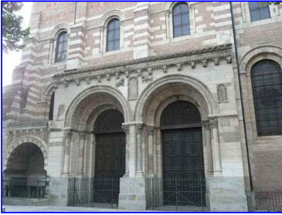
Basilica de Saint Sernin. Portada de los Condes

Vemos en esta imagen la portada correspondiente al transepto sur de la basílica o portada de los Condes. Se abre en un cuerpo levemente avanzado. Se compone de dos arcos de medio punto sin tímpano, con dos arquivoltas aboceladas que descansan en sendos capiteles figurados y columnas acodilladas. En las enjutas conformadas por los dos arcos vemos tres pequeños nichos de medio punto que en su día tuvieron esculturas pero que actualmente están vacíos.