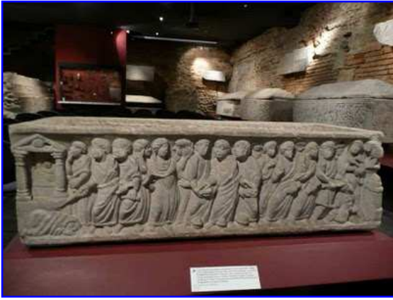
Museo Raymond. Sarcófago paleocristiano.