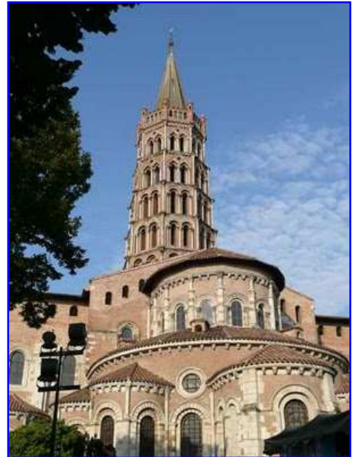
Catedral de Saint Sernin. Fachada este. Cabecera.

Tanto los absidiolos, como la girola, y la capilla mayor culminan en una cornisa pétreo sostenida por numerosos canecillos o ménsulas figuradas. La torre asciende en forma piramidal sobre el crucero y muestra cinco niveles de arcos; cada nivel de planta octogonal se retranquea con respecto al anterior, tornándose la torre progresivamente más estilizada y esbelta. En los ángulos se levantan columnas de piedra con capiteles. Culmina la torre en un espacio octogonal delimitado en cada cara por una bella galería de arquillos de medio punto; en los ángulos ascienden bonitos torreoncillos de ladrillo. Se corona la torre con un afilado chapitel piramidal con bola y cruz.