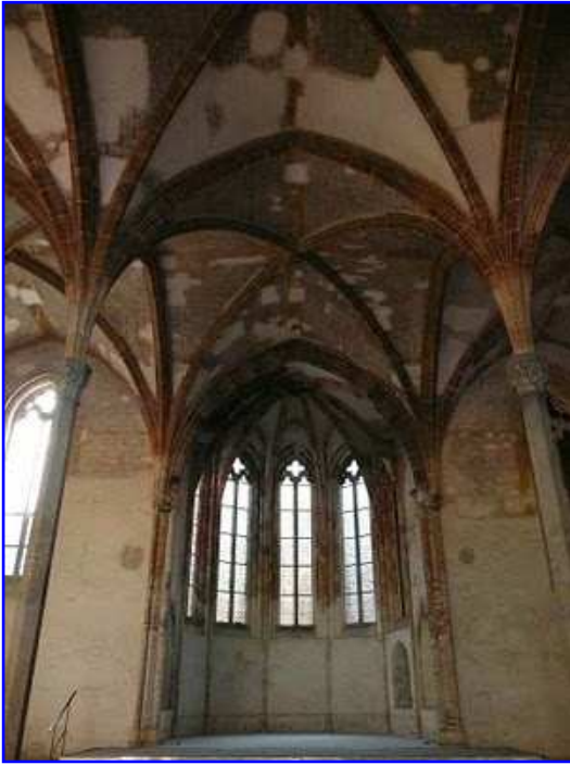
Iglesia de los Jacobinos. Claustro. Sala capitular.

Se observan finas y estilizadas columnillas poligonales que culminan en capiteles. Bóvedas de crucería simple cubren el espacio, apeando los nervios de piedra sobre las columnas. Ventanales ojivales con cuadrifolios superiores y finos parteluces se abren en los muros.