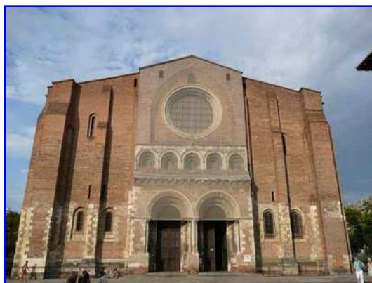
Basilica de Saint Sernin. Portada oeste.

La sobria fachada occidental de la iglesia muestra tres niveles en altura, la portada de acceso de dos arcos de medio punto geminados, escoltada por dos estrechas ventanas de medio punto a cada lado, una galería de arcos de medio punto y un gran óculo central en el hastial de la fachada enmarcado por un gran arco apuntado de impronta gótica. La piedra destaca en la parte baja, especialmente en esquinales, arcos, columnas, en los arcos de la galería central y en el enmarque del óculo superior. Potentes contrafuertes de sección rectangular, que se retranquean en la parte superior, flanquean la portada. Sobre los dos arcos de medio punto que permiten el acceso a la basílica desde el oeste se aprecia un pequeño tejazoz o cornisa de piedra que apea sobre canecillos esculpidos.