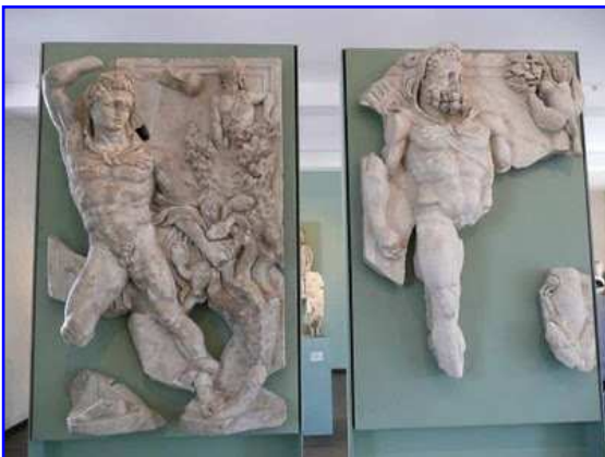
Museo Raymond. Relieves de mármol. Trabajos de Hércules.