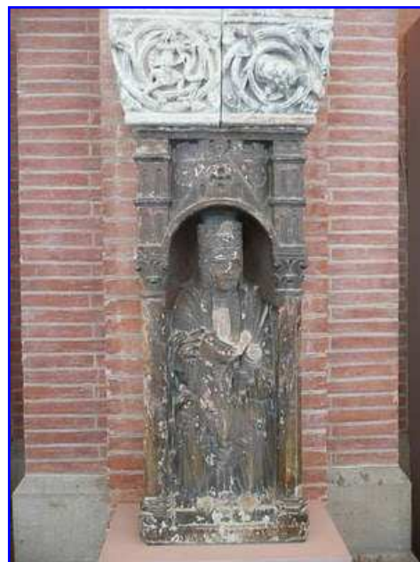
Museo de los Agustinos. Virgen románica.