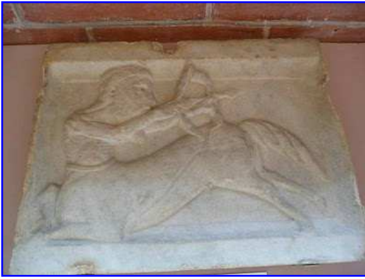
Museo de los Agustinos. Placa pétrea románica con relieve de centauro arquero.