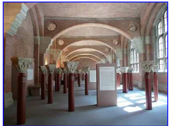
Sala de capiteles y escultura románica.