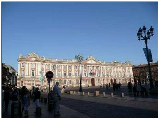
Ayuntamiento y plaza del Capitole. Vista general