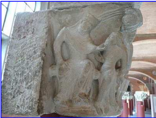
Museo de los Agustinos. Capitel románico figurado.