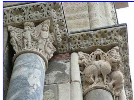
Basilica de Saint Sernin. Portada sur-Miègeville. Capiteles de la jamba derecha.

El capitel interior nos muestra una escena del Génesis. Eva y Adán a la izquierda están representados desnudos y se tapan los genitales con hojas; han cometido ya el Pecado Original, han comido del fruto prohibido. En el ángulo de la cesta del capitel un ángel, con sus alas expandidas y con pelo en escama, toma de la mano a Adán, barbado y con cabellera abundante, con la intención seguramente de expulsarlos del Paraíso. A la derecha vemos a Adán que está trabajando posiblemente con un fajo de cereal, o quizás se trata de un ovillo de lana, ayudando a Eva en su trabajo en la rueca. Son, pues tres acontecimientos sucesivos cronológicamente, según se dice en la Biblia. Al fondo, al igual que ocurre en otros capiteles, vemos una frondosidad vegetal. El escultor ha sabido representar casi en visión perspectiva, dos planos diferentes otorgando a las escenas cierta profundidad. En el capitel de la derecha se observan dos animales aleonados del Bestiario medieval, colocados simétricamente que aproximan sus cuartos traseros en el ángulo del capitel. Sobre ellos, y entre una fronda vegetal de fondo, se aprecia otra cabeza animal frontal.