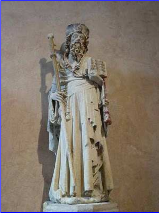
Museo de los Jacobinos. Escultura pétrea de rey.