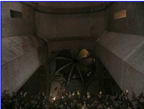
Basilica de Saint Sernin. Interior. Crucero.

La nave central que tiene dos alturas. La planta baja está formada por arcos formeros de medio punto y en la planta superior, ocupada por la tribuna, hay arcos geminados de medio punto enmarcados por otro arco de medio punto más amplio. Los arquillos apean en el centro del vano mediante columnas pareadas con atractivos capiteles esculpidos. En el intradós de ambos arquillos hay cuadrados en posición de rombo con rosetas insertas. La nave central del transepto se cubre con bóveda de medio cañón con arcos fajones que apean en semicolumnas adosadas de gran altura y hermosos capiteles. Las naves laterales se cubren con bóveda de arista. Al fondo observamos uno de los dos absidiolos del muro este del brazo meridional del transepto, el más próximo a la capilla mayor; es la capilla de la Virgen María con el Niño, cuya imagen escultórica vemos. A la derecha apreciamos parcialmente la capilla de San Germán, esto es el absidiolo situado más al sur. Ambos absidiolos tienen, como iluminación natural, tres vanos de medio punto separados por bellas columnas con capiteles. Entre ambos absidiolos el muro muestra, sobre un vano de medio punto que se abre en la planta baja, un óculo, disposición tectónica que ya hemos visto al analizar el exterior de la basílica.