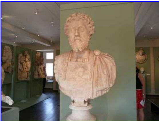
Museo Raymond. Busto romano.