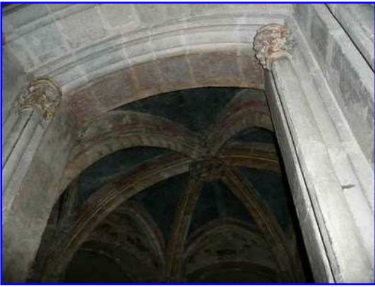
Basilica de Saint Sernin. Interior. Cripta.