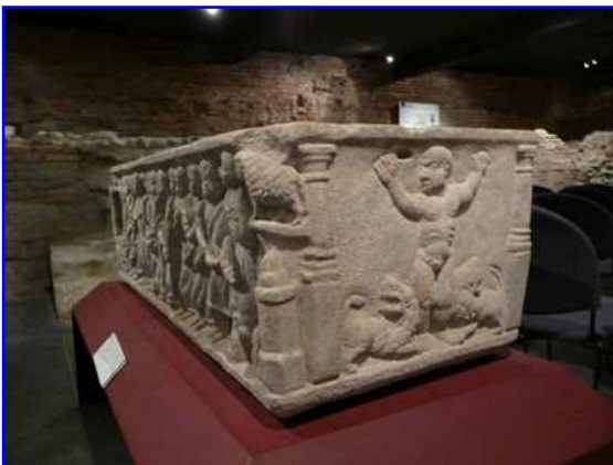
Museo Raymond. Sarcófago paleocristiano.