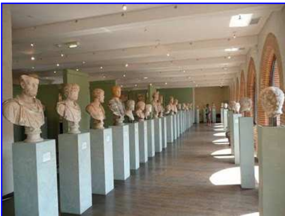
Museo Raymond. Galería de bustos romanos.