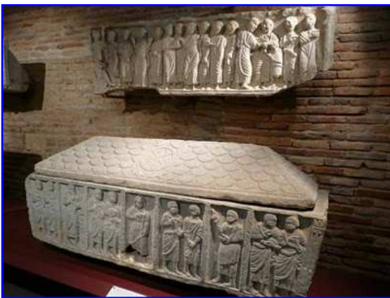
Museo Raymond. Sarcófago paleocristiano.