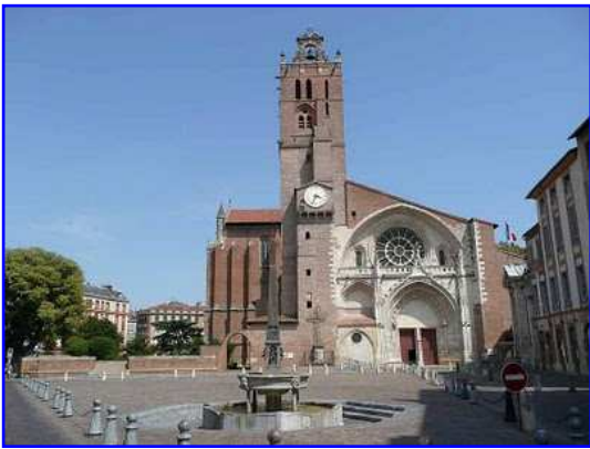
Catedral de San Esteban. Fachada oeste.

La catedral de San Esteban de Toulouse se compone básicamente de dos grandes construcciones, la nave de origen y sabor románico y el coro, de doble longitud que la nave, de impronta gótica. No existe una alineación exacta de ambos cuerpos. La parte románica se iniciaría hacia 1071 con el obispo Isam. En 1609 la bóveda del coro se quemó y el arquitecto Pierre Levesville construyó una bóveda de crucería. La fachada oeste se estructura gracias a un gran arco gótico apuntado que enmarca a la portada, también ojival, y a un gran rosetón todo ello básicamente realizado en piedra.