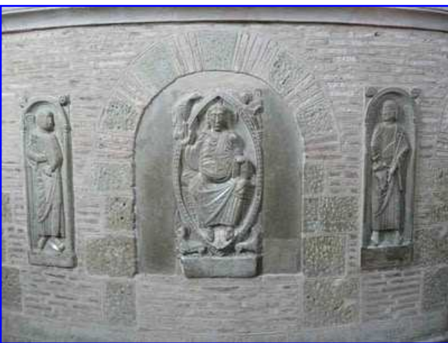
Basilica de Saint Sernin. Girola. Relieve de Bernardo Guilduino.

En la girola de la basílica hay encastradas siete placas relivarias, quizás procedentes de otro lugar