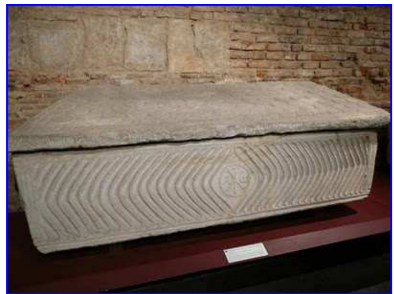
Museo Raymond. Sarcófago paleocristiano.