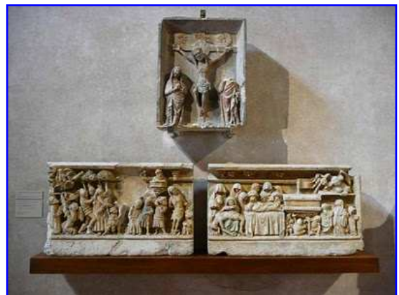
Fragmentos pétreos esculpidos, posiblemente de un retablo de piedra.