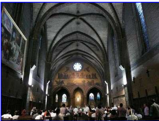
Iglesia del Taur o del toro. Vista interior hacia el este.

En la imagen superior vemos la fachada occidental de la iglesia mostrando tres niveles, el inferior donde se abre la gran portada ojival de seis sobrias arquivoltas en forma de bocel que apoyan en un capitel corrido gótico de hojarasca y en sus respectivas columnillas con sus basas. Un gablete culmina la portada con una imagen de la Virgen María erguida en un pequeño nicho ojival con tracería superior trilobulada. Flanquean la portada dos hornacinas apuntadas, también con tracería trilobulada superior, que acogen las imágenes escultóricas de dos santos nimbados. En el segundo nivel en altura observamos dos grandes vanos ojivales con un óculo en la enjuta existente entre ellos. Por último culmina la fachada con un coronamiento triangular escoltado por dos torrecillas poligonales almenadas y con chapitel, entre las que se despliegan en registros superpuestos horizontales una arquería de arquillos ciegos de medio punto y dos arquerías de arcos mitrados, similares a los de la torre-cimborrio de la basílica de San Sernin. Por último se alza un muro con almenas y merlones y un gablete triangular.