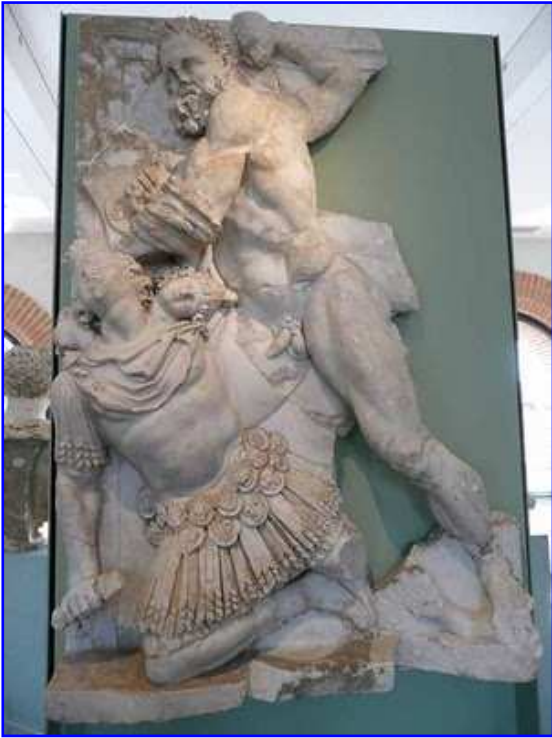
Museo Raymond. Relieves de mármol. Trabajos de Hércules.