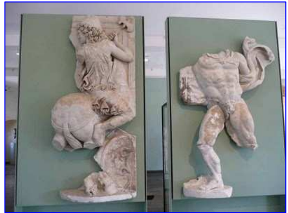
Museo Raymond. Relieves de mármol. Trabajos de Hércules.