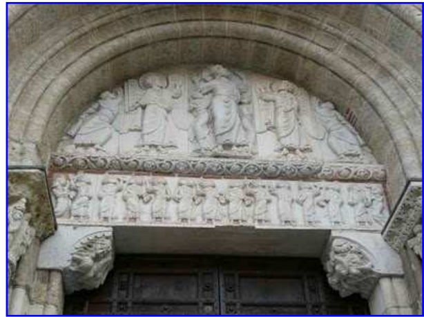
Basilica de Saint Sernin. Portada sur-Miègeville. Tímpano, dintel y ménsulas de la entrada.

La portada de Miégeville o de Media Villa es la puerta principal de la basílica y se abre en un cuerpo ligeramente avanzado del muro sur de la iglesia. Se compone de un sólo vano de medio punto, un dintel sobre dos ménsulas, un tímpano esculpido, jambas abocinadas con dos columnas con sus respectivas basas y capiteles figurados que sostienen dos arquivoltas lisas, aboceladas, y, como coronamiento, un tejeroz compuesto por una cornisa y varios canecillos. En las enjutas del arco apreciamos dos grandes placas verticales esculpidas centradas por los apóstoles Santiago y San Pedro. Todo ello realizado en piedra.