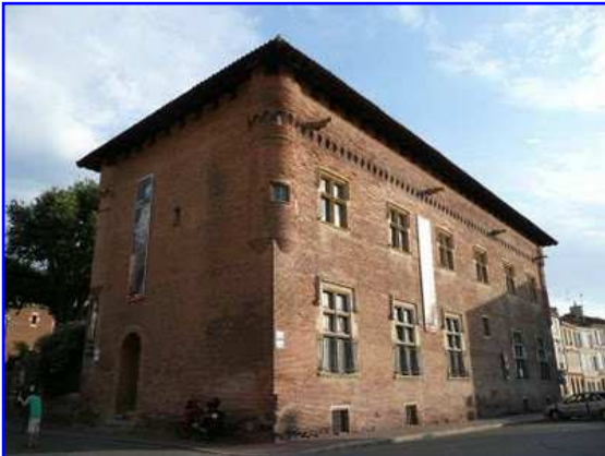
Museo Raymond. Vista exterior.