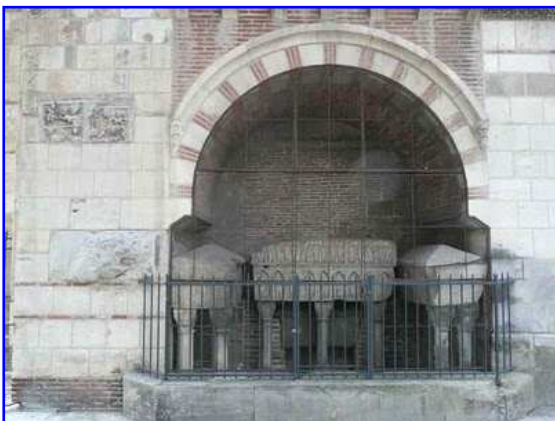
Basilica de San Sernin. Transepto sur. Arcosolio funerario de los condes de Toulouse.

Vemos en esta imagen el nicho central en el que se hallaba una imagen de San Saturnino. El nicho apenas resalta del muro de la portada, tiene arco de medio punto, con rosetas en sus enjutas, y columnillas en espiral con capitelillos. Dos leones afrontados, que vuelven sus cabezas hacia el espectador, flanquean el arco en su parte superior. Apreciamos también los canecillos de la parte central del tejazoz que exhibe una cornisa de frente moldurado y sofito esculpido. Se observa con nitidez el taqueado o ajedrezado jaqués de los arcos guardalluvias de los vanos de la portada.