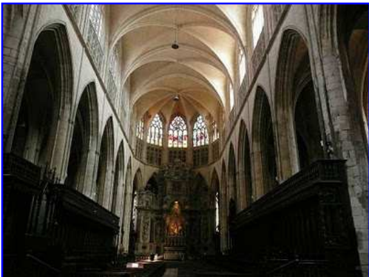
Catedral de San Esteban. Interior.

Al lado norte de la fachada se yergue altiva un torre de ladrillo que culmina en una pequeña espadaña. Observamos en esta imagen la dualidad constructiva antes comentada, el gótico más avanzado hacia el este y la parte románica y de transición al gótico hacia el oeste. Observamos una elegante portada ojival con dos arquivoltas que culmina en conopio. Sobre la portada se abre un gran vano apuntado con tracería de piedra y vitrales, flanqueado por dos torreoncillos con chapiteles cónicos. A la derecha se aprecia la gran mole de la torre de ladrillo con predominio del muro frente a los vanos.