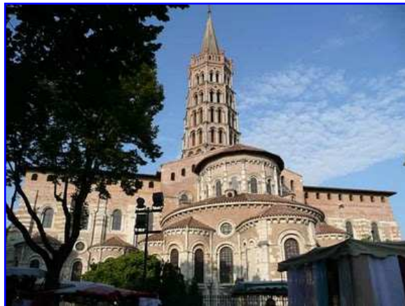
Catedral de Saint Sernin. Fachada este.

Los cuatro principales caminos franceses de peregrinación a Santiago de Compostela en época medieval, eran, de oeste a este, la Vía Turonensis, la vía Lemosina, la vía Podensis y la vía Tolosona, así denominada por pasar por la ciudad de Toulouse; en ella se hallaba una de las cinco "iglesias de peregrinación", la iglesia de Saint Sernin de Toulouse. Las otras iglesias de peregrinación eran San Martín de Tours, San Marcial de Limoges, ambas desaparecidas, Saint Foy de Conques y Santiago de Compostela.