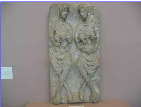
Museo de los Agustinos. Relieve románico "Signum leonis, signum arietis".