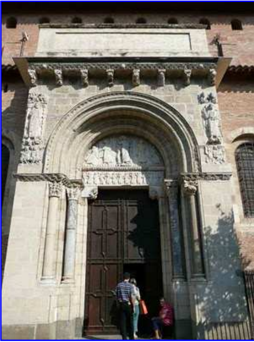
Basilica de Saint Sernin. Portada sur-Miègeville.

La portada de Miégeville o de Media Villa es la puerta principal de la basílica y se abre en un cuerpo ligeramente avanzado del muro sur de la iglesia. Se compone de un sólo vano de medio punto, un dintel sobre dos ménsulas, un tímpano esculpido, jambas abocinadas con dos columnas con sus respectivas basas y capiteles figurados que sostienen dos arquivoltas lisas, aboceladas, y, como coronamiento, un tejeroz compuesto por una cornisa y varios canecillos. En las enjutas del arco apreciamos dos grandes placas verticales esculpidas centradas por los apóstoles Santiago y San Pedro. Todo ello realizado en piedra.