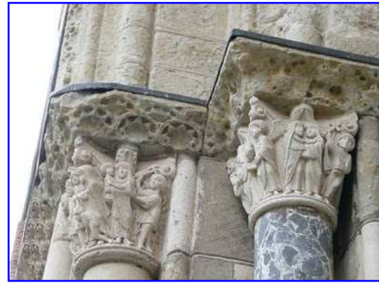
Basilica de Saint Sernin. Portada sur-Miègeville. Capiteles de la jamba izquierda.

En el capitel exterior se representa la Matanza de los Inocentes. Apreciamos a madres, con velos sobre sus cabezas, con sus hijos en brazos, vemos personajes armados con espadas para matar a los niños. En el capitel interior se representa, a la izquierda la escena de la Anunciación del arcángel San Gabriel a la Virgen María, el arcángel lleva en su mano izquierda un bastón que culmina en cruz y con la derecha señala a María. En el ángulo del capitel otro ángel maneja el incensario, dirigiéndose a la Virgen. A la derecha observamos la escena de la Visitación de María a su prima Santa Isabel. Ambas mujeres, con túnicas, mantos y velos, se abrazan. Un ángel, junto a ellas, lleva una cruz en su mano derecha y un libro en la izquierda.