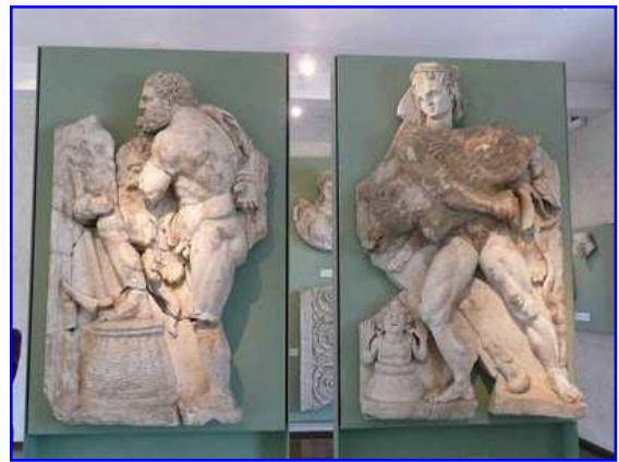
Museo Raymond. Relieves de mármol. Trabajos de Hércules.