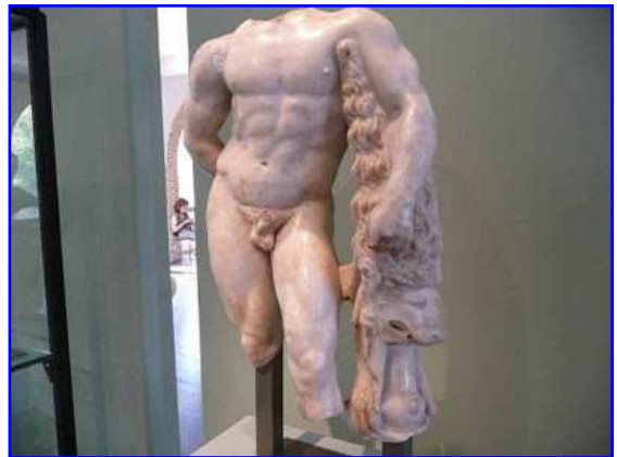
Museo Raymond. Desnudo masculino clásico en mármol.