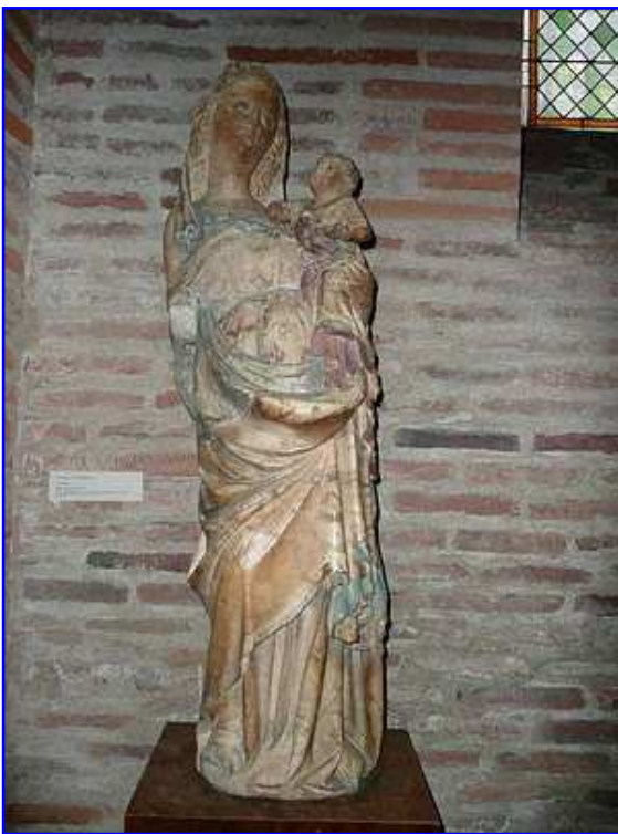
Museo de los Agustinos. Imagen pétrea de la Virgen María con el Niño.