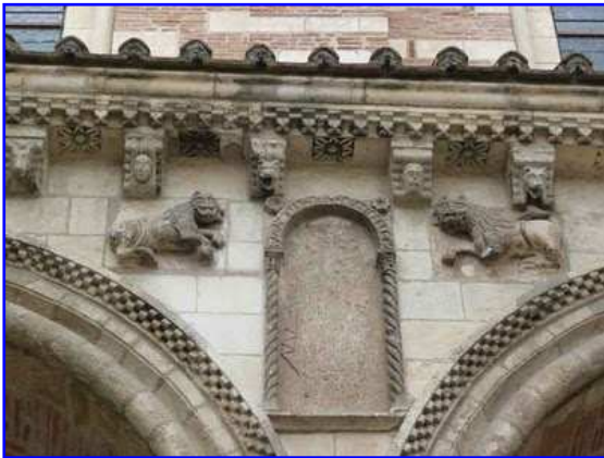
Basilica de Saint Sernin. Portada de los Condes. Enjuta central y tejazoz.

Como protección de la portada se despliega una cornisa sobre dieciséis ménsulas o canecillos con diversos motivos iconográficos. Sobre la portada vemos el muro sur del transepto abierto por una línea de vanos de medio punto con columnillas acodilladas y ajedrezado jaqués en el arco exterior. Obsérvese el ritmo tectónico impuesto por los contrafuertes contruidos con hiladas alternativas de piedra blanca y ladrillo rojo que confieren una agradable visualidad al muro. Sobre la hilera de ventanas de medio punto predomina ya el ladrillo, dueño y señor de las alturas de la basílica.