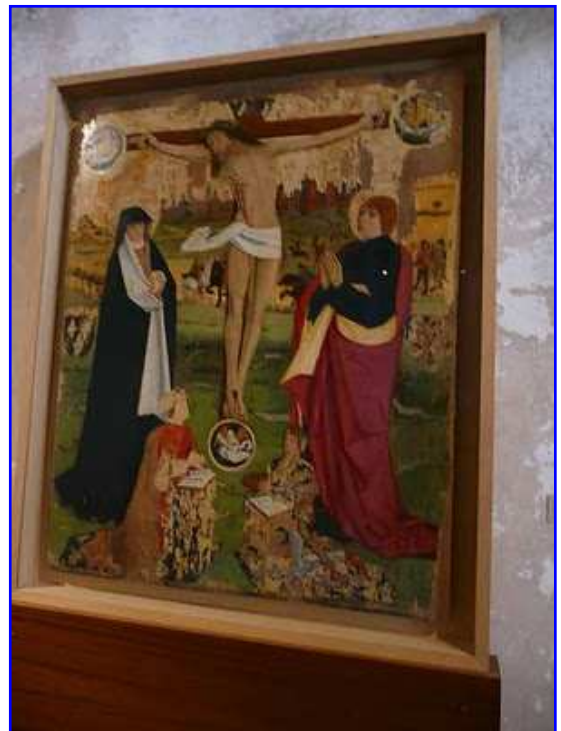
Museo de los Agustinos. Tabla de Pintura gótica.