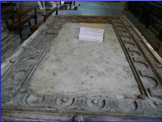
Basilica de Saint Sernin. Interior. Mesa de altar románica.

En la cabecera puede accederse a dos criptas en altura que existen en la basílica de Saint Sernin. La superior tiene forma de exágono y se entra en ella por dos escaleras situadas a ambos lados del deambulatorio. Sus ventanas se abren a la girola. En ella se conservan relicarios que quedaron tras la Revolución de 1789, entre ellas el relicario de San Saturnino. Desde esta cripta superior se desciende a la inferior desde dos escalerillas ubicadas en dos lados del exágono. En ella se abren seis capillas donde se veneran diversas reliquias