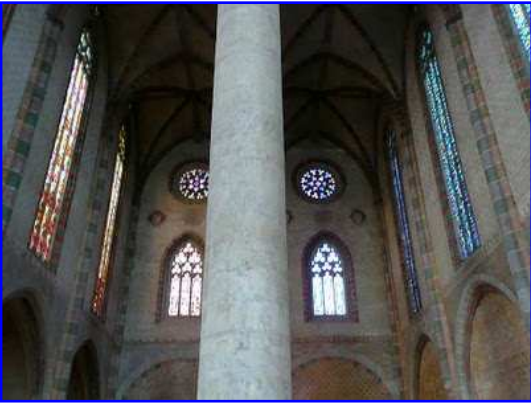
Iglesia de los Jacobinos. Vista interior de naves y muro occidental.

En esta imagen se observa el interior de la iglesia vista hacia occidente. Se ve el interior de la fachada occidental con su nivel de arcos formeros, su nivel de arcos apuntados y su nivel de óculos, ambos cerrados con vidrieras. Apenas se observan las capillas situadas entre los estribos.