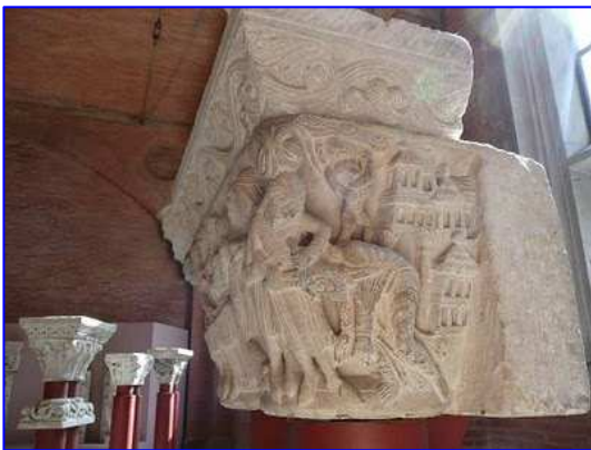
Museo de los Agustinos. Capitel románico figurado.