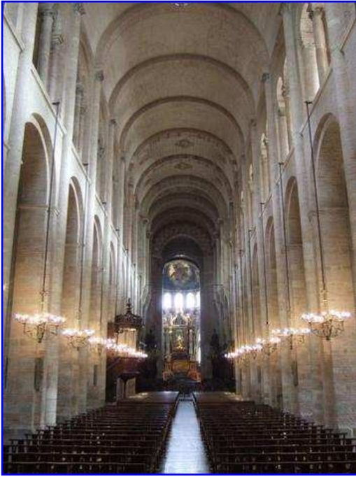
Basilica de Sain Sernin. Interior. Nave principal.