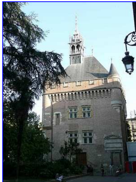
Donjon o torre del Capitoul

La torre del Capitoul o torre del homenaje data del siglo XVI. Es la antigua torre que albergaba los archivos de la ciudad ya desde los tiempos en que los capitoles administraban Toulouse. Es el único edificio que se conserva del antiguo ayuntamiento. Sobrevivió a las reformas iniciadas en 1750 que acabaron con la parte medieval del conjunto y sobrevivió a las importantes modificaciones urbanas realizadas por Haussmann en el siglo XIX. En 1873 fue restaurado por el famoso arquitecto Eugène Viollet le Duc que le añadió un campanario al estilo nórdico flamenco de fuerte pendiente y pizarra, que contrasta con la generalidad de tejados de la ciudad que se caracterizan por cubrirse con teja y con vertientes de escasa pendiente. Hoy cobija la oficina de Turismo de Toulouse.