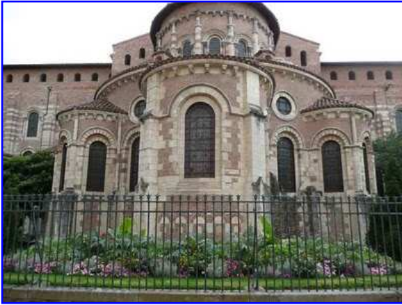
Catedral de Saint Sernin. Fachada este. Detalle del ábside.

Es de agradable visualidad el contraste cromático de los diferentes materiales, la piedra, el ladrillo y los vitrales emplomados. En los vanos de medio punto de la nave mayor apreciamos columnas acodilladas con capiteles. La cornisa pétreo de la girola, soportada por canecillos, muestra un ribete de bolas y entre ménsula y ménsula vemos metopas-alero con rosetas esculpidas.