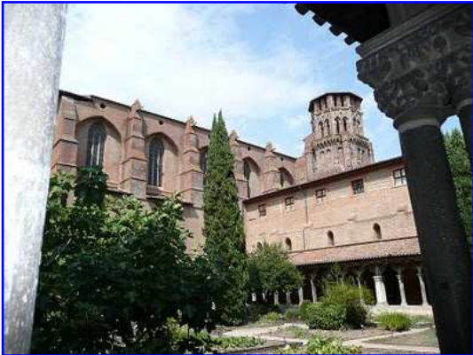
Museo de los Agustinos. Vista del Claustro.

El Museo de los Agustinos de Toulouse ocupa el antiguo convento de la orden Agustina. Fué construido en los siglos XIV y XV. Alberga desde 1793 numerosas obras de arte de pintura y escultura desde época paleocristiana hasta el siglo XX en las distintas estancias dispuestas en torno al claustro principal y en la propia iglesia conventual. Son de destacar la escultura románica y la escultura gótica.