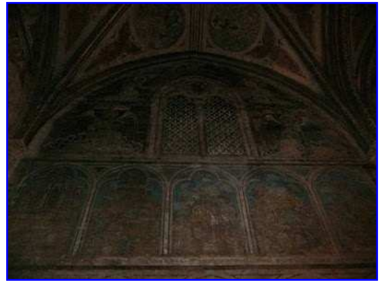
Iglesia de los Jacobinos. Claustro. Capilla de San Antonin. Pinturas murales. La capilla de San Antonin se decora con pinturas murales religiosas del siglo XIV.

Se observan finas y estilizadas columnillas poligonales que culminan en capiteles. Bóvedas de crucería simple cubren el espacio, apeando los nervios de piedra sobre las columnas. Ventanales ojivales con cuadrifolios superiores y finos parteluces se abren en los muros.