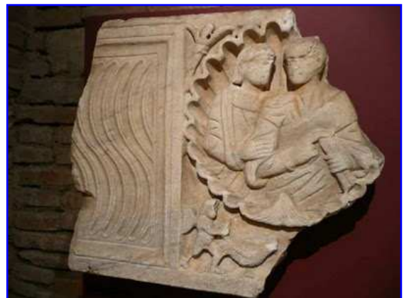
Museo Raymond. Fragmento de sarcófago paleocristiano.