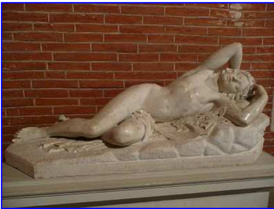
Museo de los Agustinos. Escultura. Desnudo.

El Museo de los Agustinos de Toulouse ocupa el antiguo convento de la orden Agustina. Fué construido en los siglos XIV y XV. Alberga desde 1793 numerosas obras de arte de pintura y escultura desde época paleocristiana hasta el siglo XX en las distintas estancias dispuestas en torno al claustro principal y en la propia iglesia conventual. Son de destacar la escultura románica y la escultura gótica.