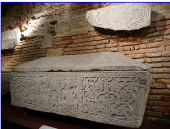
Museo Raymond. Sarcófago paleocristiano.