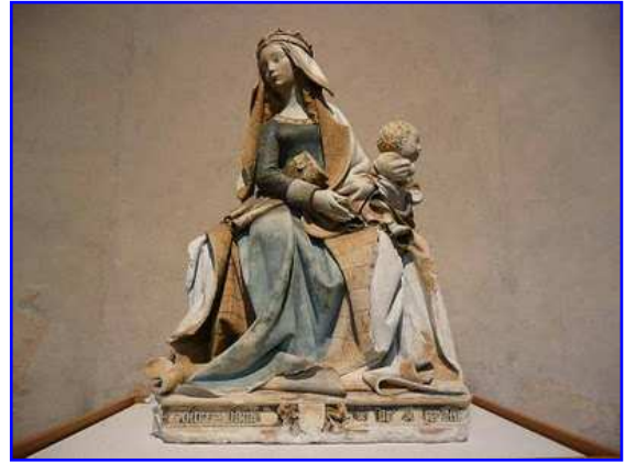
Museo de los Agustinos. Virgen María con Niño.