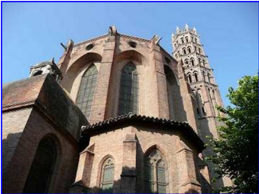
Iglesia de los Jacobinos. Cabecera y torre.