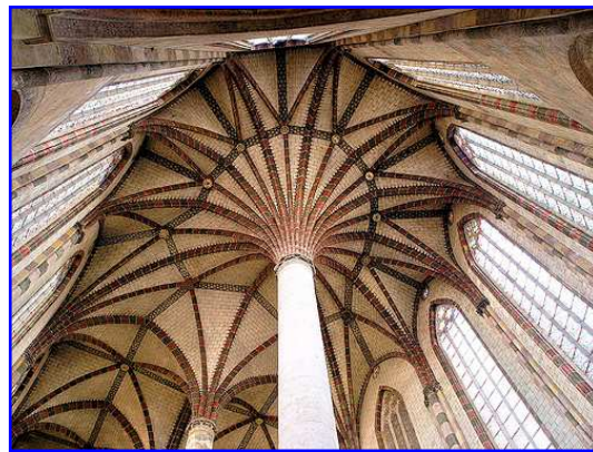
Iglesia de los Jacobinos. Vista de la bóveda de la cabecera en forma de palmera.