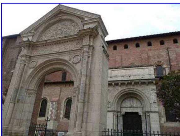
Basilica de Saint Sernin. Portada renacentista en primer término y portada Miègeville al fondo.

El portal del portal del siglo XVI es un bello vestigio del muro de cierre que en época renacentista envolvía la basílica. Se estructura como una arco de triunfo totalmente de piedra, de un solo vano de medio punto, flanqueado por dos columnas adosadas a pilastras, con tondos circulares en las enjutas, con un entablamento que exhibe una cartela central flanqueada por decoración vegetal y frontón triangular que enmarca un tímpano ornamentado con una columna central vertical rodeada por motivos vegetales a modo de grutescos simétricos.