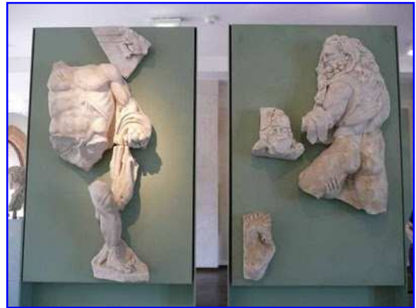
Museo Raymond. Relieves de mármol. Trabajos de Hércules.