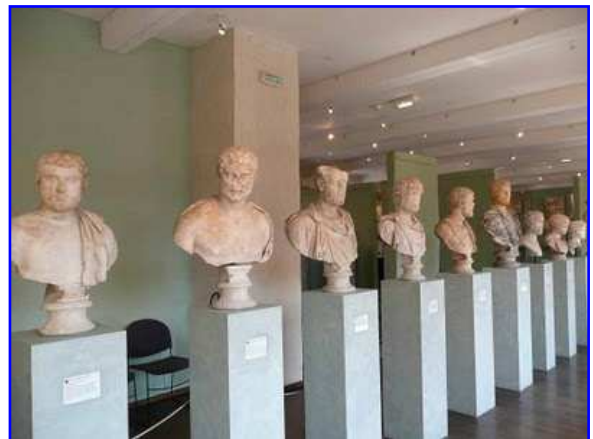
Museo Raymond. Galería de bustos romanos.