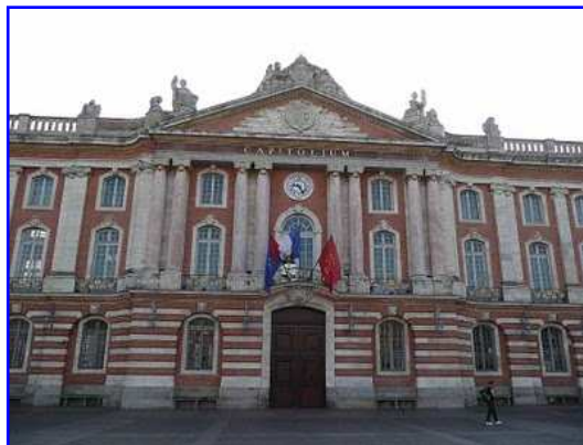
Ayuntamiento. Detalle de la fachada central

El edificio conocido como "Capitole", en la plaza homónima, alberga el ayuntamiento de la ciudad de Toulouse y el Teatro Nacional. El nombre parece derivar de la existencia de un templo romano dedicado al dios Júpiter en el monte Capitolino ubicado en la zona. Los munícipes o miembros del consejo municipal se denominaban capitolos. Si bien el edificio municipal se retrotrae hasta 1190, su aspecto actual, especialmente la fachada principal corresponde a 1759. La fachada muestra un cuerpo central a modo de templo clásico columnado con frontón triangular, y dos alas laterales, cuyos extremos se realzan mediante pilastras y pequeños frontones semicirculares. Sobre los frontones y en el tímpano de los mismos destacan grupos escultóricos. La fachada se estructura en planta baja o planta calle, tratada a modo de zócalo del edificio y dos plantas superiores ritmadas por pilastras gigantes en las alas y columnas gigantes pareadas en el cuerpo central.