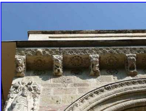
Basilica de Saint Sernin. Portada sur-Miegeville. Placa relivaria en la enjuta derecha del arco de entrada. Imagen de San Pedro.

Sobre el vano de medio punto de la portada se despliega horizontalmente, como protección, un tejeroz compuesto de cornisa y ocho canecillos. Entre ellos tanto en el espacio del alero, sofito, como del muro, metopa, vemos rosetas de doce pétalos con botón central. Un friso compuesto de palmetas enroscadas, repetidas decoran el extremo longitudinal de la cornisa. Los motivos decorativos que muestran los canecillos son vegetales, animales y cabezas antropomorfas.