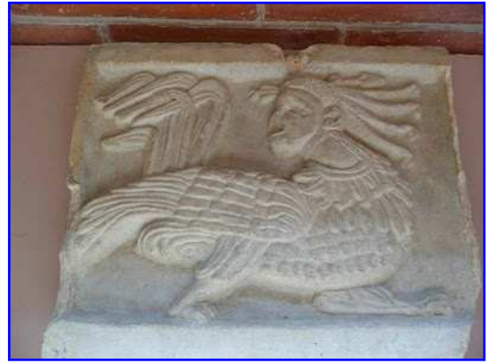
Placa relivaria románica con arpía.