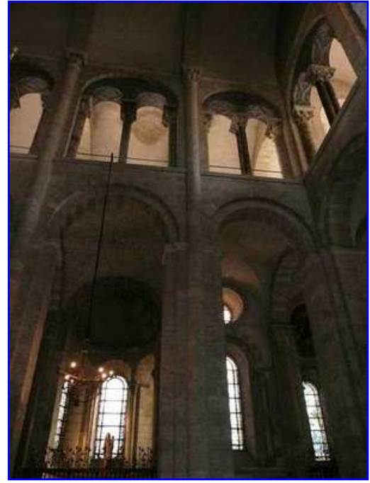
Basilica de Sain Sernin. Interior. Nave transversal (transepto).

La nave central que tiene dos alturas. La planta baja está formada por arcos formeros de medio punto y en la planta superior, ocupada por la tribuna, hay arcos geminados de medio punto enmarcados por otro arco de medio punto más amplio. Los arquillos apean en el centro del vano mediante columnas pareadas con atractivos capiteles esculpidos. En el intradós de ambos arquillos hay cuadrados en posición de rombo con rosetas insertas. La nave central del transepto se cubre con bóveda de medio cañón con arcos fajones que apean en semicolumnas adosadas de gran altura y hermosos capiteles. Las naves laterales se cubren con bóveda de arista. Al fondo observamos uno de los dos absidiolos del muro este del brazo meridional del transepto, el más próximo a la capilla mayor; es la capilla de la Virgen María con el Niño, cuya imagen escultórica vemos. A la derecha apreciamos parcialmente la capilla de San Germán, esto es el absidiolo situado más al sur. Ambos absidiolos tienen, como iluminación natural, tres vanos de medio punto separados por bellas columnas con capiteles. Entre ambos absidiolos el muro muestra, sobre un vano de medio punto que se abre en la planta baja, un óculo, disposición tectónica que ya hemos visto al analizar el exterior de la basílica.