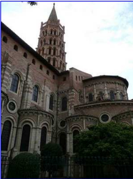
Basilica de Saint Sernin. Detalle del transepto sur y cabecera.

En la nave mayor se observa que sobre la cornisa pétreo soportada por canecillos no descansa directamente el tejado como parece preceptivo; es posible que se haya producido un recrecimiento mural en algún momento de la historia de la iglesia. Nuevamente se aprecia la belleza del juego de volúmenes y de la disparidad de formas (vanos de medio punto, óculos, etc.) y de colores. En algunos de los contrafuertes de la nave transepto vemos una elegante alternancia de piedra y frisos de ladrillo que recuerdan a ese efecto visual usado por los romanos en el acueducto de los Milagros de Mérida y por los musulmanes en la Mezquita de Córdoba, por ejemplo.