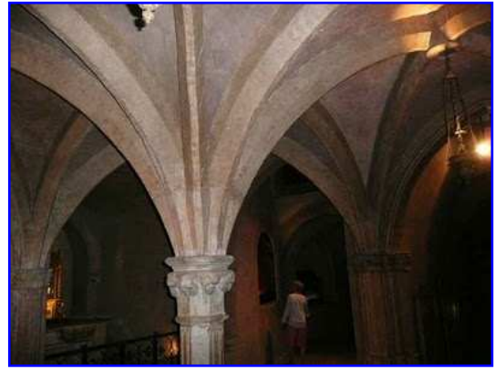
Basilica de Saint Sernin. Interior. Cripta.

En la cabecera puede accederse a dos criptas en altura que existen en la basílica de Saint Sernin. La superior tiene forma de exágono y se entra en ella por dos escaleras situadas a ambos lados del deambulatorio. Sus ventanas se abren a la girola. En ella se conservan relicarios que quedaron tras la Revolución de 1789, entre ellas el relicario de San Saturnino. Desde esta cripta superior se desciende a la inferior desde dos escalerillas ubicadas en dos lados del exágono. En ella se abren seis capillas donde se veneran diversas reliquias