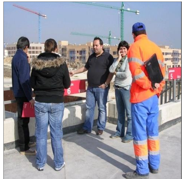
El concejal de medioambiente, una técnico y un operario en el punto limpio

La Agenda surge como adhesión a la Conferencia de Medio Ambiente y Desarrollo que se celebró en Río de Janeiro en junio de 1992. Los objetivos específicos para nuestro municipio dentro de este plan de acción son: definir un Plan de acción local, desarrollar actuaciones en educación y sensibilización ambiental, reforzar nuestra capacidad para prevenir problemas ambientales y convertirnos en un ejemplo de prácticas respetuosas con el medio ambiente.