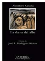
"La Dama del Alba"