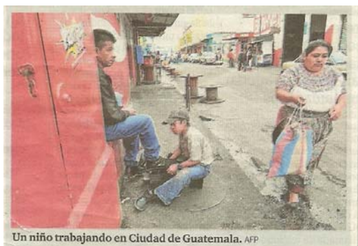
Un niño trabajando en Ciudad de Guatemala.