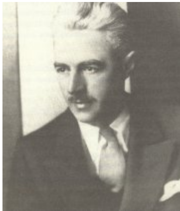
Dashiell Hammett (1894-1961)

Poe, en "El doble crimen de la calle Morge", inauguró el género policíaco y el género negro posterior al crack de 1929, porque, al escribir esta historia, planteó al lector el juego de descubrir una verdad, en apariencia sobrenatural, con las armas de la razón, a través de una investigación detectivesca. Esa voluntad del novelista, esta complicidad con el lector, exige al escritor no hacer trampas en la construcción de sus historias criminales y plantea, al mismo tiempo, una relación privilegiada con el receptor de sus novelas. Divertir, entretener, emocionar, escribir para ser leído... ¿No es este el objetivo de la Literatura? Hay que jugar limpio con el lector. ¡Las manos quietas o disparo! Para freír un huevo, es preciso romper la cáscara. Siempre.