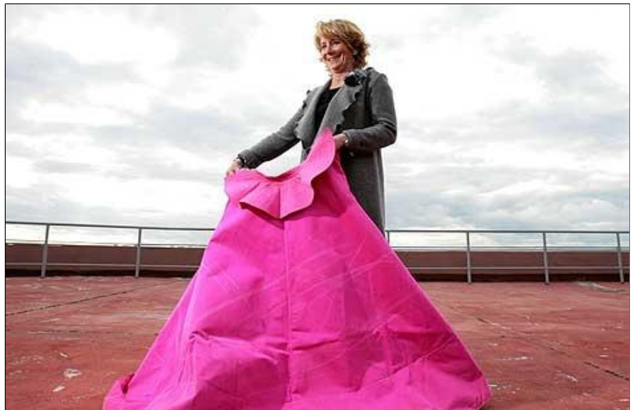
Esperanza Aguirre quiere declarar de interés cultural en Madrid la fiesta taurina