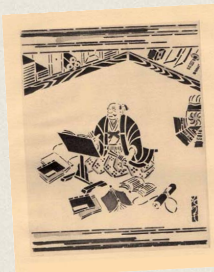
Quijote japonés de Kyoto, 1936. Edición única de 75 ejemplares.

L a Biblioteca del Castillo de Peralada contiene actualmente más de 80.000 volúmenes, destacando las 1.000 ediciones de El Quijote en distintas lenguas. Posee además de las ediciones de 1605, 1608, 1614, y 1617, importante material impreso efímero: juegos de naipes, cromos y tarjetas.