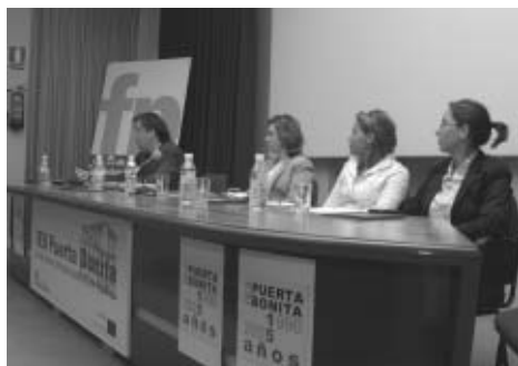
Presentación del Seminario de Creación de Empresas.

En breve cerraremos el ciclo correspondiente a este curso académico con el proceso de selección de los Planes de Empresa a los que otorgaremos la posibilidad de establecerse durante un año natural en el espacio físico del IES Puerta Bonita dotándoles de una oficina dotada y abriéndose la posibilidad en función de la disponibilidad de las instalaciones de utilizar medios técnicos específicos para su proceso productivo.