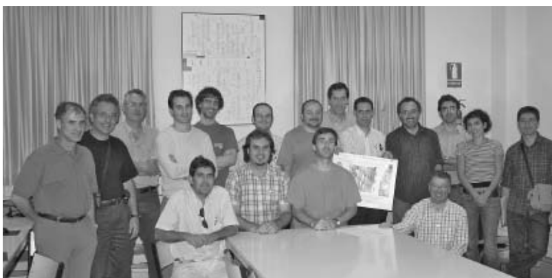
Asistentes al Curso de Gestión de Calidad en procesos de diseño y tratamiento del color impartido en el IES PUERTA BONITA