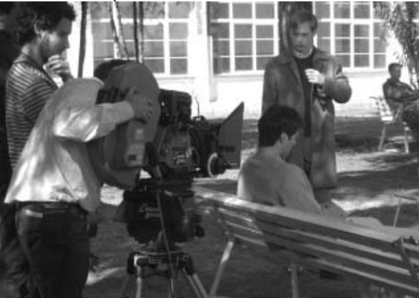
Rodaje de la película "Ciclo Dreyer" de Álvaro del Amo.