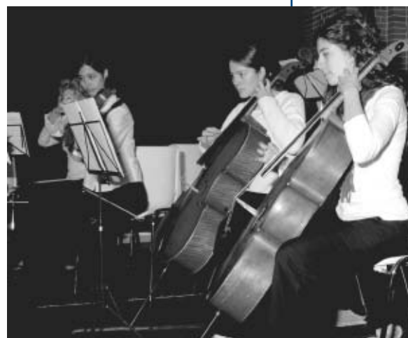
Concierto Didáctico en el Teatro-Capilla.