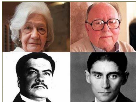
Ana María Matute, Augusto Monterroso, Ruben Darío y Franz Kafka; cuatro autores clásicos que practicaron el microrrelato

Al pasar a su lado, el bolso de una señora peliteñida intentó morderle. No pudo alcanzarle, y atacó a la mujer en el costado con un mordisco definitivo. También los zapatos de un caballero le amputaron a su dueño los pies a la altura de la ingle. Pero aún la sorpresa convertía aquello en un curioso divertimento. El bolso se había convertido en un cocodrilo, igual que las lagartijas crecen a partir de su